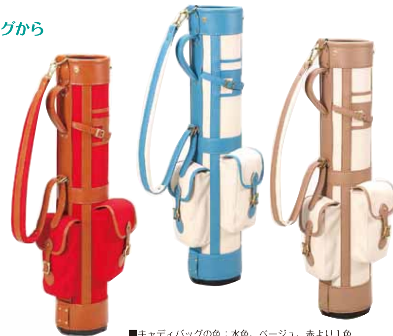
■キャディバッグの色：水色、ベージュ、赤より1色

持っているだけでワクワクするような、帆布地を使ったスタイリッシュでお洒落なキャディバッグを3色ご用意しました。ゴルフ場の青い空をイメージさせる「水色」、大人の女性にもぴったりな「ベージュ」、他の人とはかぶらない個性的な「赤」。ボールやマーカーなど必要な小物をポケットに収納し、なおかつ「6.5インチ、2.3kg」というコンパクトなサイズは、初心者だけでなくすべての女性にマッチします。